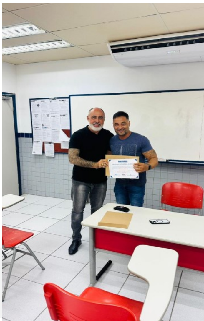
Figura 1: Entrega de Certificado – “Prof, Destaque”

No ano de 2025, receberam o certificado de " Excelência Acadêmica " 10,7% dos professores, já o certificado de " Professor Destaque " foi concedido a 25% dos professores. Tiveram que fazer o plano de ação de melhoria para o próximo semestre, 10,7% dos professores, por terem recebido em pelo menos uma das quinze questões, média abaixo de 3,9.